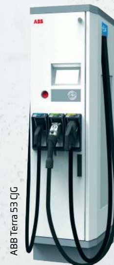
ABB Terra 53 C1G