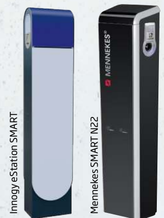
Innogy eStation SMART