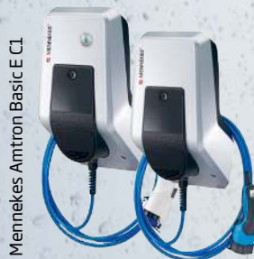
Mennekes Amtron Basic E C1