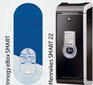
Innogy eBox SMART